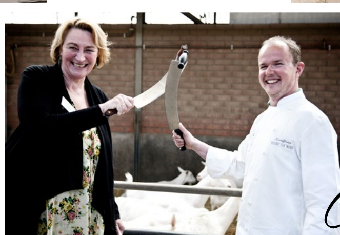
DE BATTLE OF THE